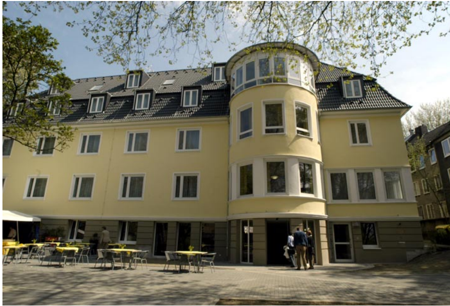
Das Martin-Luther-Haus ist eines der sechs Altenheime des Diakoniewerks Ruhr Bochum